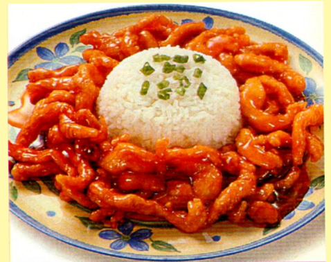
129. POLLO TIPAKAY S/ 23.00