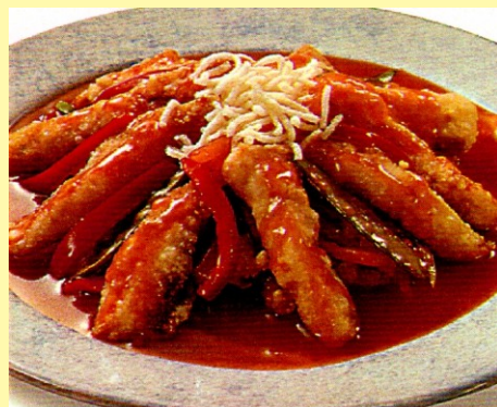
137. PESCADO ARREBOZADO CINCO SABORES S/ 26.00