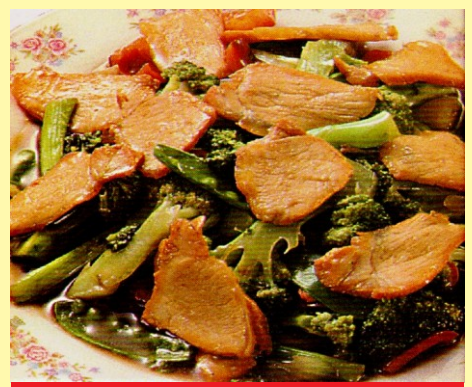
151. CHANCHO CON BRÓCOLI S/ 24.00