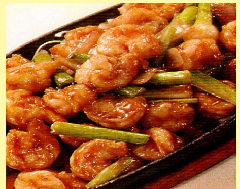
144. LANGOSTINO A LA PLANCHA S/ 36.00