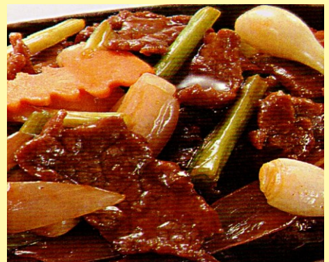
146. CARNE DE RES A LA PLANCHA S/ 31.00