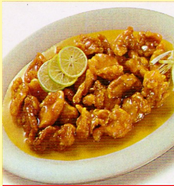
155. CHANCHO CRUYOC AL LIMÓN S/ 23.00