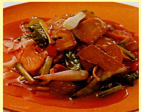
153. CHANCHO ASADO C/ TAMARINDO S/ 24.00