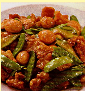
158. CHANCHO CRUYOC C/ HUEVOS DE CODORNIZ S/ 26.00