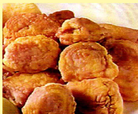
138. PESCADO EN CHICHARRÓN S/ 26.00