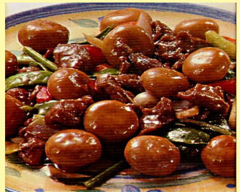
147. CARNE DE RES CON CHAMPIÑONES S/ 29.00