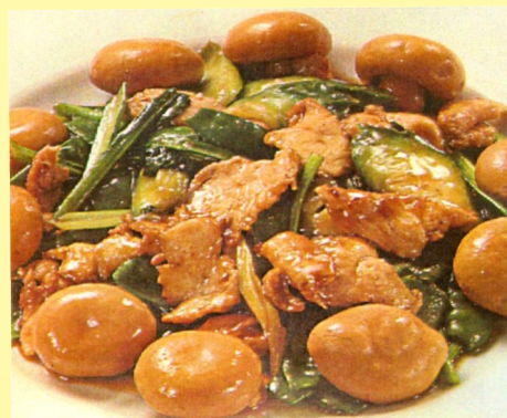
126. POLLO CON CHAMPIÑONES S/ 26.00