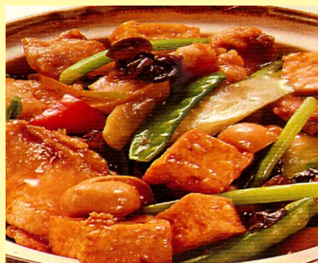
140. PESCADO ARREBOZADO C/ VERDURAS S/ 28.00