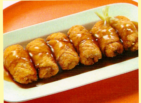
127. POLLO ENROLLADO C/ LANGOSTINOS S/ 26.00