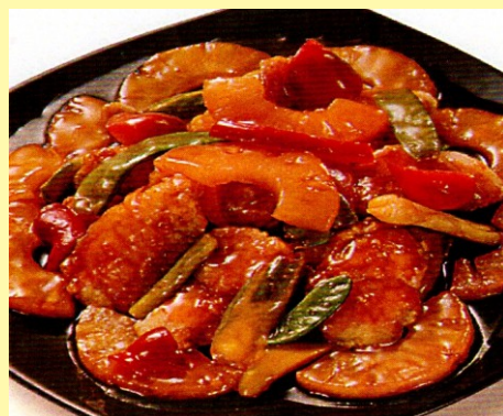
139. PESCADO CON PIÑA S/ 25.00