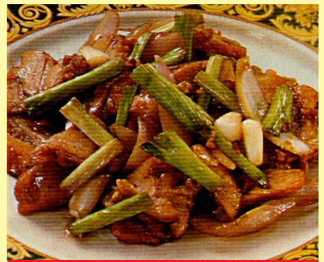
152. CHANCHO AL AJO S/ 24.00