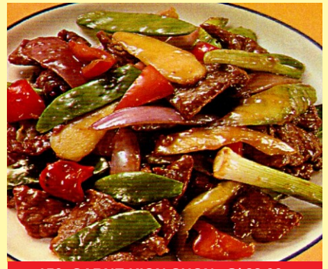
150. CARNE KION CHON S/ 23.00