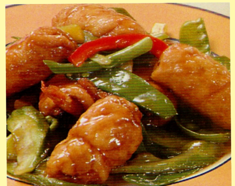
128. POLLO FON KIN CHON LONG S/ 31.00