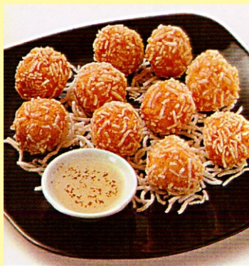
160. PERLA DE LANGOSTINO S/ 31.00