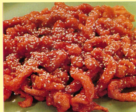
125. POLLO ARREBOZADO C/ TAMARINDO S/ 23.00