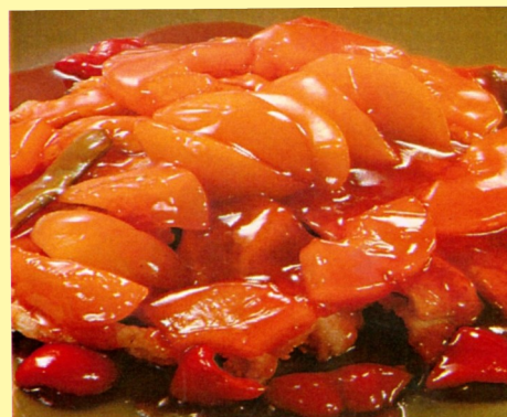
123. POLLO CON DURAZNO S/ 27.00