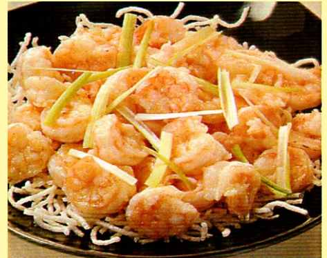
141. LANGOSTINO CRISTAL S/ 26.00