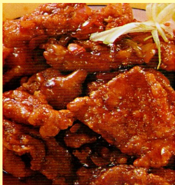
157. CHANCHO CRUYOC KIN TU S/ 26.00