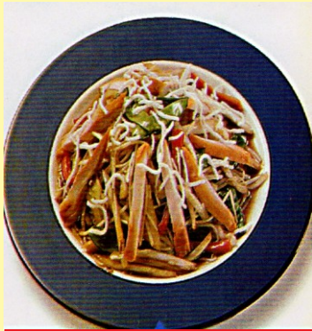
154. CHANCHO CHAP SUEY S/ 23.00