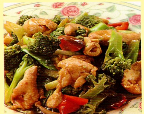
130. POLLO ARREBOZADO C/ BRÓCOLI S/ 23.00