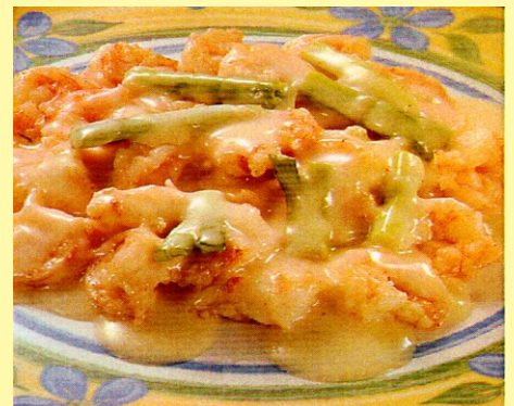
142. LANGOSTINO EN SALSA BLANCA S/ 26.00