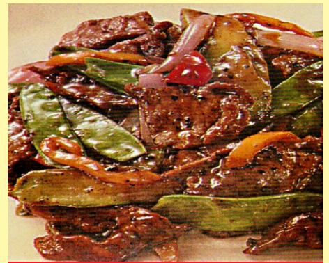
148. CARNE DE RES CON TAUSÍ S/ 26.00