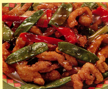
124. POLLO ARREBOZADO C/ OSTIÓN S/ 23.00