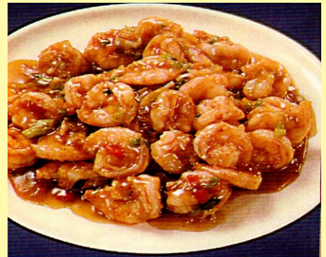
143. LANGOSTINO EN SALSA HUI LAMB S/ 26.00