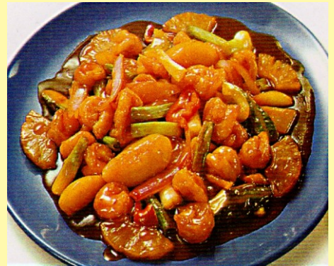
145. LANGOSTINO SUI PEI S/ 26.00